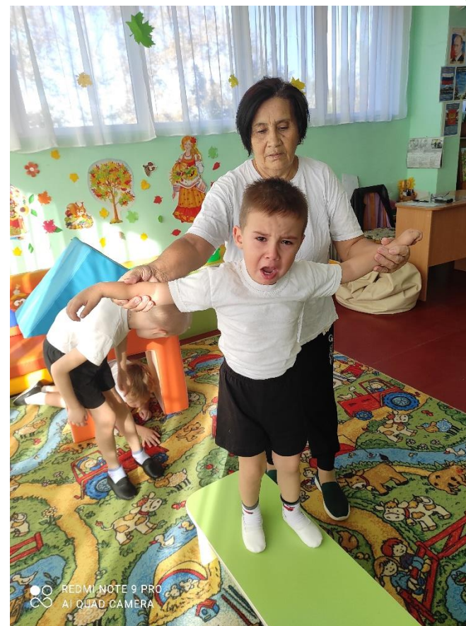
Вторая половина дня. «Полоса препятствий»